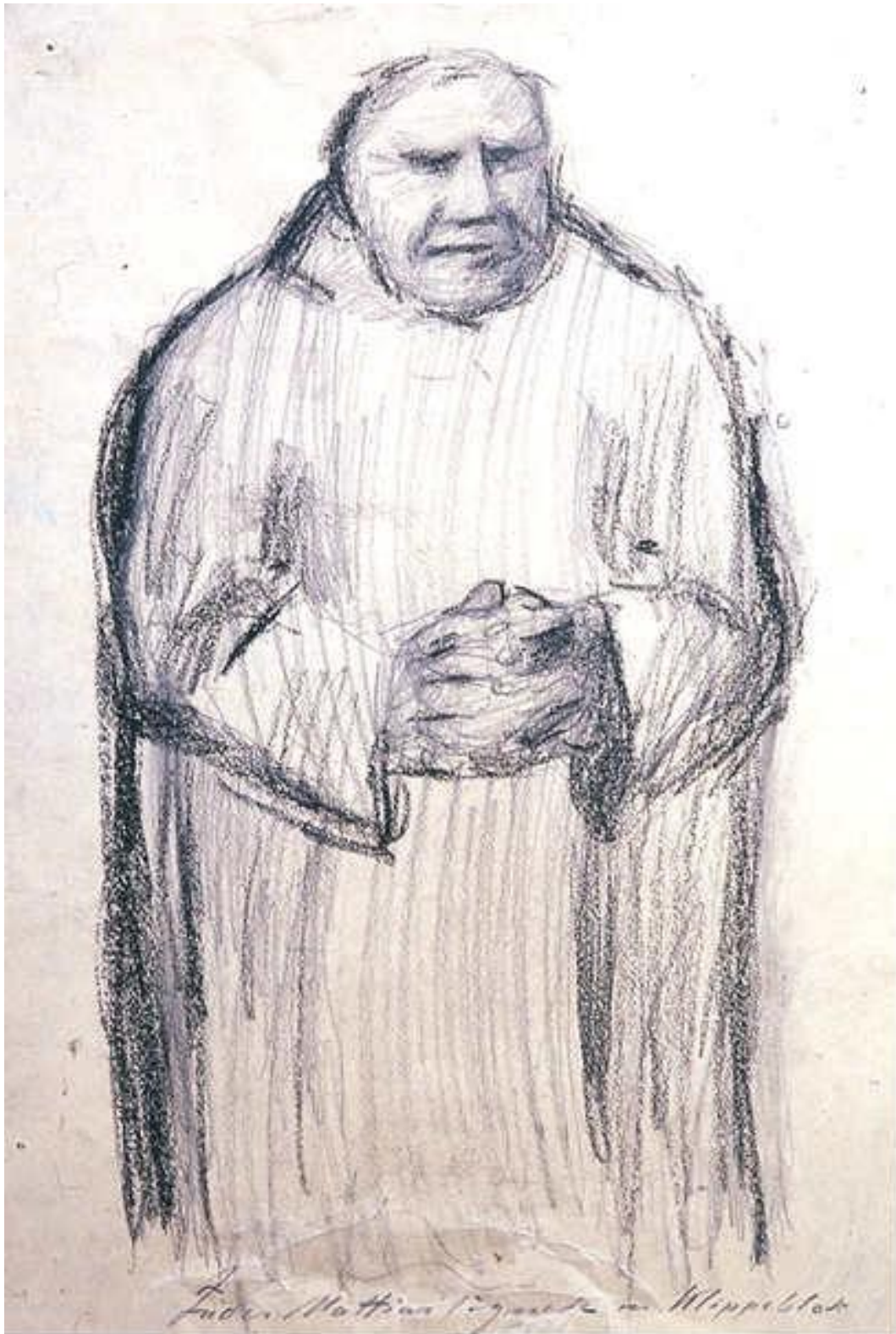
Fader Mattias ved klippeblok – tegning af MAH.