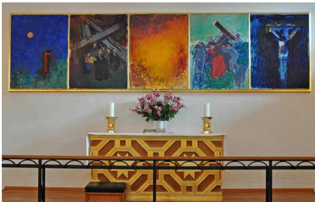
Havsteen-Mikkelsens "femfløjede" altertavle i Skt.. Marcus kirken i Århus