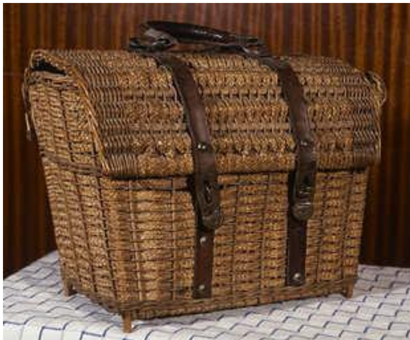
Bedstemoderens kurv som drengen fik med til at bære paradisæblerne i – kurven befinder sig nu på Østsjællands Museum