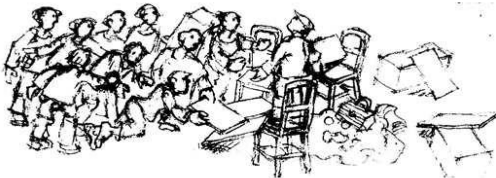
Skitse til scene i "Paradisæblerne" ved Ullrich Rössing

Hansens historie Paradisæblerne , hvor karaktererne er mennesker på landet i et fattigt Danmark i 1920'erne.