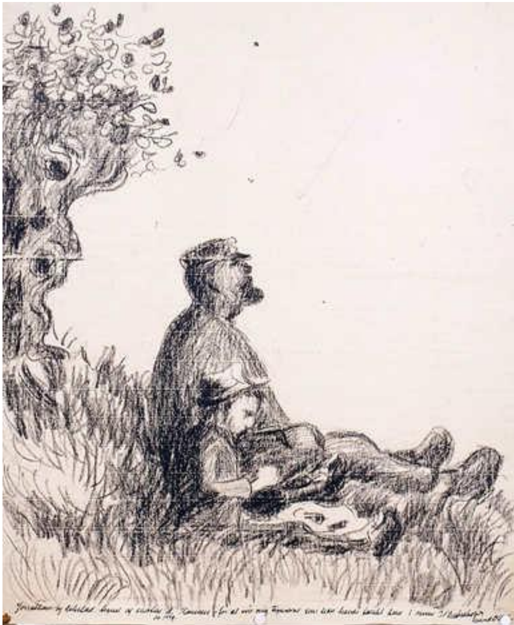
Jonathan og Askelad fra bogen "Jonathans Rejse" tegnet af Martin A. Hansen i 1948

mod Naturen. Kultur driver ikke som Skyer med Vinden, den styrker Hjertet med Viden for at kunne gaa imod den.